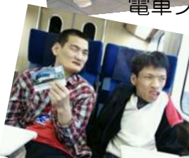
秋のミステリーツアーと題し リニア鉄道館へ行ってきました。 名古屋駅では「しまかぜ」に遭遇