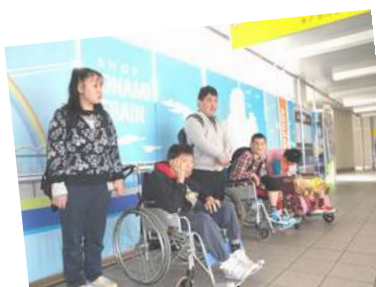
電車ブーム到来中のつくしんぼ一志。