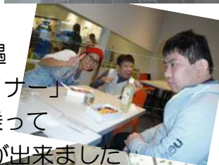
帰りの特急は赤い「伊勢志摩ライナー」 たくさんの電車を見て、触れて、乗って 充実した1日を過ごすことができました